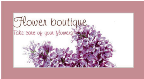
Şekil 2. Kendi tasarımınıza örnek – Yatay Önyüz